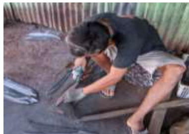
Gambar 2. Proses Maccari' (Pembentukan Bilah Alat pada Bahan Besi)

Setelah pemilihan bahan, pengrajin melakukan proses maccari' , yaitu menggambar pola sekaligus membentuk bilah alat pada permukaan besi sebagai acuan pemotongan. Selanjutnya besi dipotong menggunakan gerinda dan dipisahkan dengan bantuan palu sesuai bentuk yang diinginkan. Setelah itu dilakukan penghalusan awal untuk membentuk mata bilah alat.