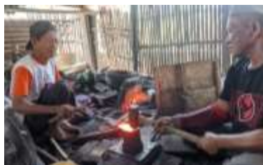
Gambar 4. Aktivitas Panre Bessi dengan Teknik Penempaan Tradisional

Hasil observasi juga menunjukkan adanya variasi teknik dalam aktivitas kerja Panre Bessi . Sebagian besar pengrajin telah menggunakan alat modern seperti gerinda dalam proses pemotongan dan penghalusan. Namun demikian, masih terdapat pengrajin yang mempertahankan teknik tradisional berupa pembakaran dan pemukulan berulang hingga membentuk alat yang diinginkan.