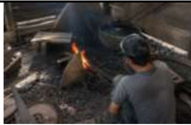
Gambar 3. Proses Pemanasan atau Seppo

Hasil observasi juga menunjukkan adanya variasi teknik dalam aktivitas kerja Panre Bessi . Sebagian besar pengrajin telah menggunakan alat modern seperti gerinda dalam proses pemotongan dan penghalusan. Namun demikian, masih terdapat pengrajin yang mempertahankan teknik tradisional berupa pembakaran dan pemukulan berulang hingga membentuk alat yang diinginkan.