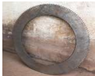
Gambar 1. Bahan Baku dari Besi kampas Kereta Api

Berdasarkan hasil observasi, proses pembuatan alat tradisional dilakukan melalui beberapa tahapan kerja, yaitu pemilihan bahan, penggambaran pola ( maccari' ), pembentukan bilah, pemanasan ( seppo ), dan penghalusan akhir. Bahan baku yang digunakan umumnya berasal dari besi bekas kampas kereta api yang berbentuk lingkaran.